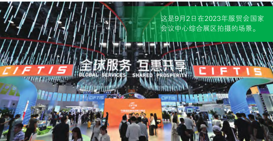
这是9月2日在2023年服贸会国家会议中心综合展区拍摄的场景。

快。2021年发达经济体数字传输服务贸易出口额占全球的比例为77.9%，较2005年下降8.3个百分点。