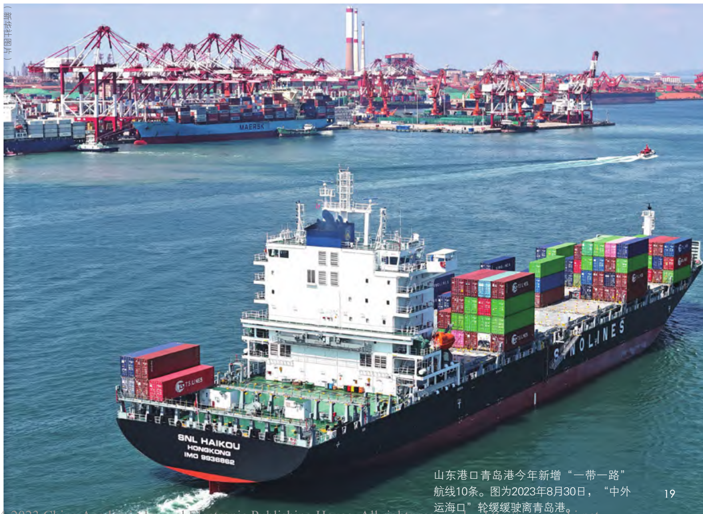
山东港口青岛港今年新增“一带一路”航线10条。图为2023年8月30日，“中外运海口”轮缓缓驶离青岛港。

充分发挥各方优势和激发各方潜能，将经济的互补性转变为务实的经贸合作成果。世界银行研究报告显示，“一带一路”倡议可使共建国家之间的贸易规模增加4.1%，如果进一步进行相关的贸易改革和运输基础设施升级，这种贸易促进效应将扩大3倍。 [4] 中国商务部数据显示，2022年中国与“一带一路”沿线国家货物贸易额达到2.07万亿美元，较2013年翻了一番，年均增长8%，占中国货物贸易总额的比例达到32.9%，较上年提升3.2个百分点。在投资方面，2013—2022年，中国与沿线国家双向投资累计超过2700亿美元。在工程建设方面，2013—2022年，中国在沿线国家承包工程新签合同额累计超过1.2万亿美元，完成营业额累计超过8000亿美元，占中国总额的比例均超过一半。尤其是中欧班列的开通运行和境外经贸合作区的建立，直接带动了东道国的贸易投资增长和就业。中国商务部数据显示，2022年，中欧班列开行超过1.6万列，较上年增