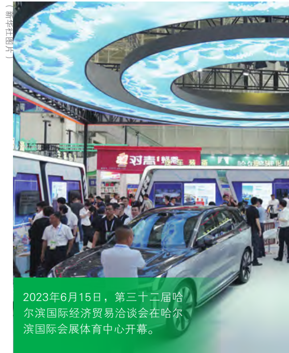
2023年6月15日，第三十二届哈尔滨国际经济贸易洽谈会在哈尔滨国际会展体育中心开幕。

四是推动重塑全球经贸治理体系。近年来，全球经贸环境和经贸关系持续恶化，全球经贸治理的民主赤字、制度赤字和责任赤字日益加重。个别国家单边主义大行其道，以国内立法代替国际规则、以单边决策取代集体共识、以自身利益凌驾于全球共同利益之上、以多边主义之名行贸易霸凌之实。在现行经贸治理体系中，广大发展中国家的话语权和决策权受到严重侵害，合法利益得不到应有的制度性保障。同时，在数字贸易、低碳贸易和可持续投融资等领域仍未形成普遍公认的国际规则，某些霸权国家借机将国内规则国际化和实施所谓“长臂管辖”。即便对已有的制度安排，一些发达经济体也不能履行应尽责任和义务，甚至干扰和破坏多边贸易体制。截至2022年12月，美国已连续60次在WTO争端解决机构例会上否决启动上诉机构成员遴选程序的相关提案，并试图限制一些发展中国家应享有的特殊与差别待遇。 [7] 在此背景下，发展中国家改革现有全球经贸治理体系的诉求日趋强烈，这更赋予了共建“一带一路”推动重塑全球经贸治理体系的功能。通过“一带一路”国际合作平台，共建国家坚持真正的多